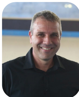
אבי פרץ, יו"ר איגוד הטניס